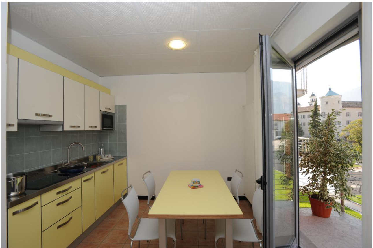
Fig. 5 | San Michele all'Adige, Fondazione Edmund Mach. Le residenze

Si stima che l'intero intervento avrà un costo di circa 5 milioni di euro che può essere suddiviso come di seguito: