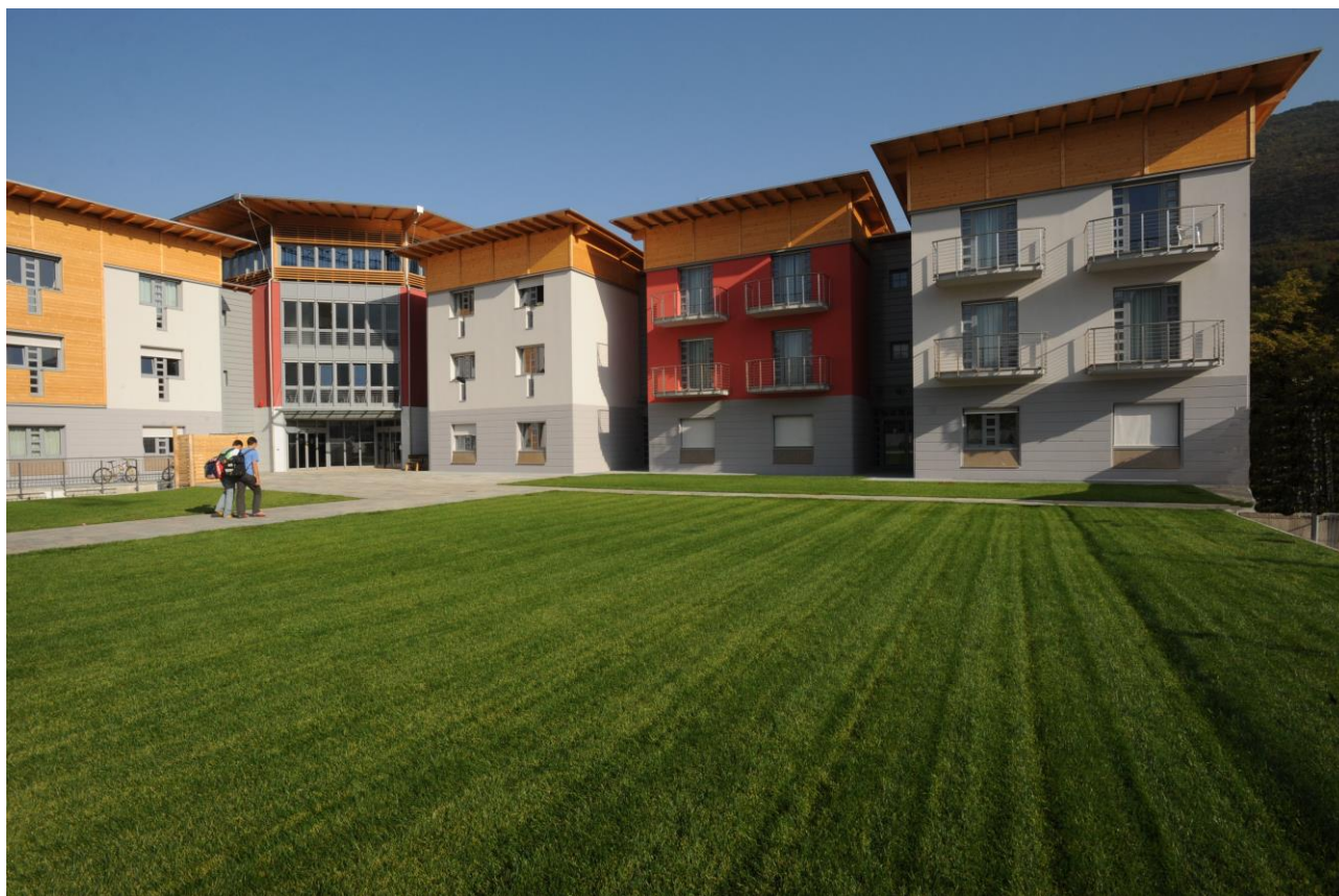
Fig. 2 | San Michele all'Adige, il campus della Fondazione Edmund Mach

L'ipotesi progettuale si basa sull'esperienza maturata con realizzazione nuovo campus di S. Michele all'Adige, in Trentino, e che ospita la sede della Fondazione Edmund Mach, uno dei soggetti capofila della rete che ha elaborato la presente proposta.