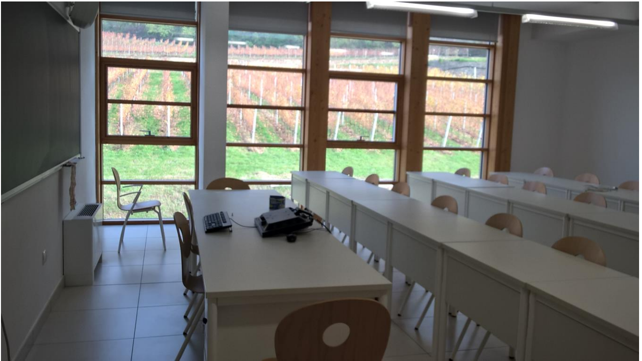
Fig. 3 | San Michele all'Adige, Fondazione Edmund Mach. Le aule