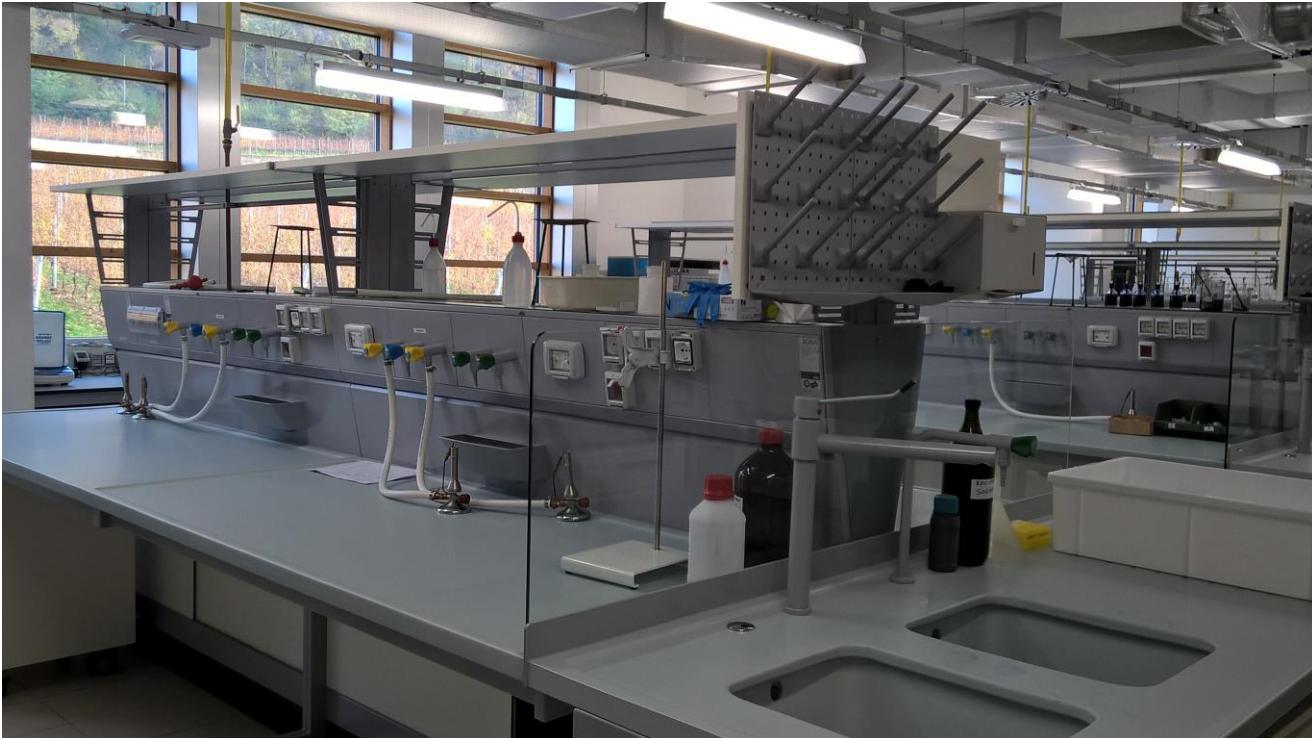
Fig. 4 | San Michele all'Adige, Fondazione Edmund Mach. I laboratori